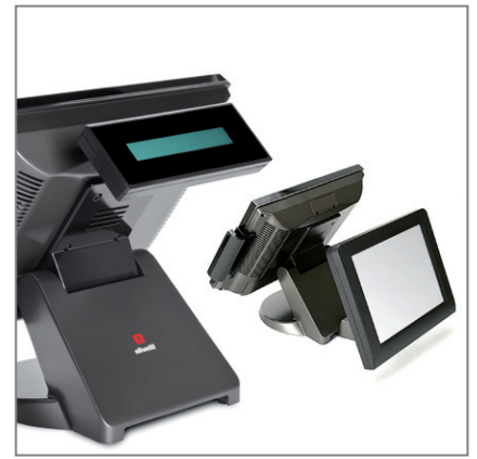
DISPLAY CLIENTE O SECONDO DISPLAY LCD (opzionali)