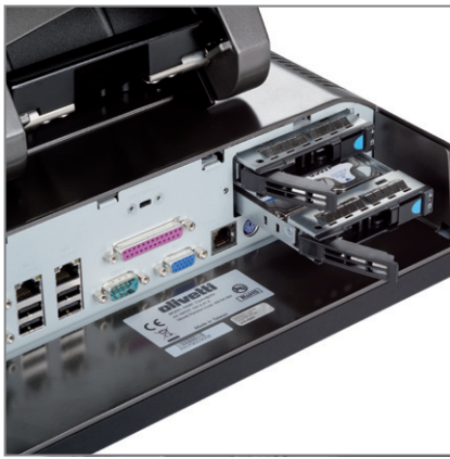
SUPPORTA 2 GIGA LAN, 2 HARD DISK RIMOVIBILI CON FUNZIONE RAID 0,1